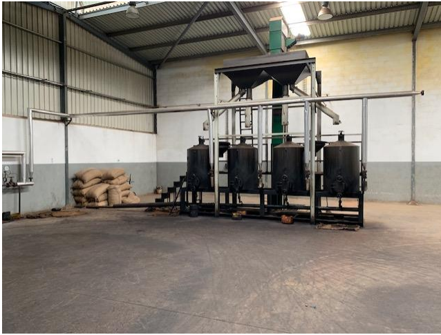
Mitambo ya kuchemsha inayolishwa kwa mkono