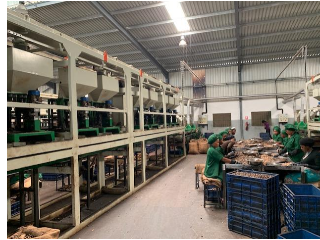
Ubanguaji kwa mitambo pamoja na mkono