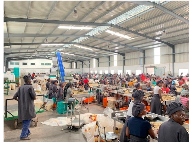
Mitambo ya kumenya kiotomatiki lakini kutenganisha za kurudiwa kazi kwa mkono