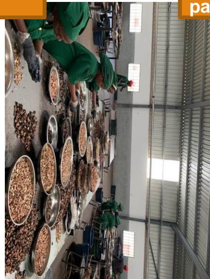
Uhotaji kwa mkono kurudia michakato