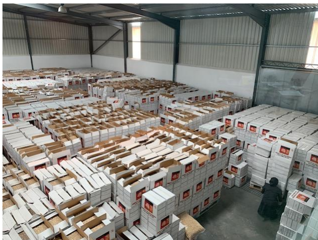
Utenganishaji otomatiki kwa rangi lakini siyo kwa ukubwa